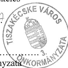
Tiszakécske Város Önkormányzata Tóth János polgármester